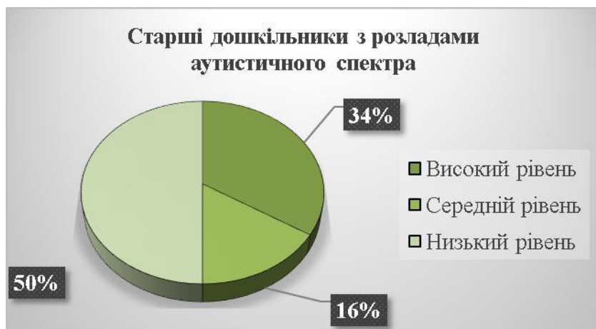
Рис. 1. Стан сформованості пасивного словника у дітей старшого дошкільного віку з аутизмом (у %)

Результати дослідження. На Рис. 1. представлено узагальнені результати стану сформованості пасивного словника дітей старшого дошкільного віку з аутизмом.