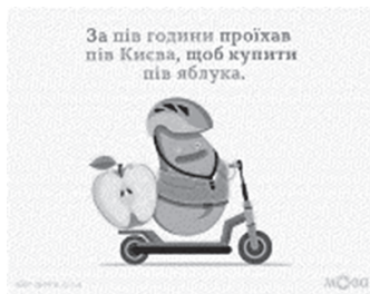
Рис. 6. Приклад ілюстрацій у додатку «Мова. ДНК Нації»

4. Мова. ДНК Нації [5] – цікавий і корисний застосунок, що підійде для використання як дітьми, так і дорослими. Головний герой – Лепетун навчатиме правил орфографії, орфоєпії, збагатить словник новими фразеологізмами, синонімами, паронімами, відкоригує суржик і допоможе закріпити весь пройдений матеріал. Додаток дуже подобається дітям, адже в ньому є безліч ілюстрацій зі стислими правилами й цікаві вправи, розвиває почуття гумору учнів (див. рис. 6 ).