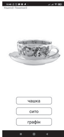
Рис. 3. Гра «Відгадуємо слово»

Наступний розділ «Відгадуємо слово» (див. рис. 3 ) можна використовувати в роботі з учнями початкової ланки з порушеннями психофізичного розвитку для закріплення і повторення або перевірки вивченого матеріалу. Гра дуже цікава і динамічна. Із трьох слів потрібно вибрати одне до поданого зображення. Якщо дитина вгадує правильно, то слово озвучується, у випадку помилки звучить інший звуковий сигнал, що буде корисним для розвитку слухового сприймання й уточнення словника дитини.