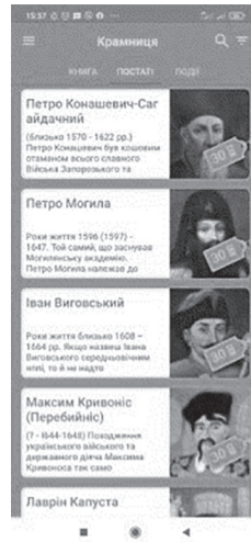
Рис. 4. Безкоштовний додаток «P.I.D.»

3. Вивчайте українську мову [2]. Це хороший додаток для вивчення української мови разом з учнями з особливими освітніми потребами, що допомагає весело вивчати українську мову в ігровій формі і складається з таких розділів: абетка, слова, речення. При цьому є можливість розвитку слухового сприймання, адже всі слова озвучено, перевірки орфографії. Розділ «Слова» репрезентовано відповідно до лексичних тем, кількість яких достатня, причому подані лексеми як у прямому, так і в переносному значенні (див. рис. 5).