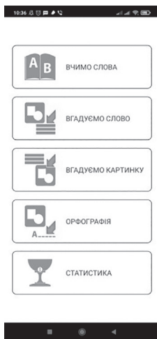
Рис. 1. Учимо та граємо

Перший розділ «Учимо слова» поділяється на підрозділи: алфавіт, слова, дієслова, словник і самоконтроль. Для першого класу чудово підійде використання першого пункту: «Алфавіт». Усі букви озвучено, тому діти можуть як побачити, так і прослухати звуки, що є важливим не тільки для розвитку слухового сприймання учнів з порушеннями слуху і зору, а й для підготовки до читання чи закріплення вивченої букви на уроці. Пункт «Слова» (див. рис. 2) поділений на теми, що може використовуватися для закріплення лексичних тем удома, на уроках, як один із видів роботи.