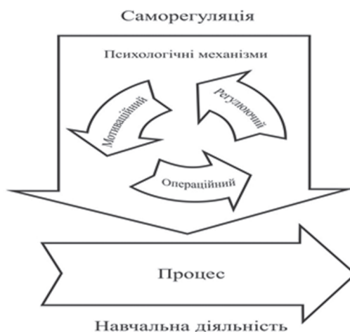
Мал. 1. Структура саморегуляції навчальної діяльності

Цілеспрямований розвивальний вплив на механізми саморегуляції створює позитивні умови для їх ефективного розвитку, що позитивно відображається на навчальній діяльності школяра (мал. 1). Як результат, механізми саморегуляції можуть розглядатися як механізми, які спрямовують і коректують навчальну діяльність.