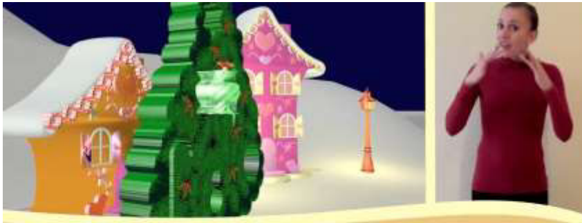
Рис. 3. Приклад відео для дітей з перекладом жестовою мовою (з сервісу YouTube)

Отже, формування комунікативної компетентності фахівців медичної сфери у роботі з особами з порушеннями слуху може значно полегшити взаємодію і допомогти забезпечити якісну медичну допомогу.