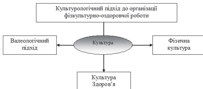
Мал. 1. Складники культурологічного підходу до фізкультурно-оздоровчої роботи з дітьми зі складними порушеннями розвитку* *- власна розробка автора

Отже, культурологічний підхід розглядається науковцями в якості метапринципу функціонування і розвитку освіти, у якому висвітлюються ідеї гуманізації і гуманітаризації у контексті світової і національної культур, зорієнтовуючи при цьому особистість на смислопошукову, творчу, розвивальну діяльність. Культурологічний підхід виступає підґрунтям розроблення варіативних моделей змісту освіти, що не лише відновлює її, а й стримує у контексті культури.